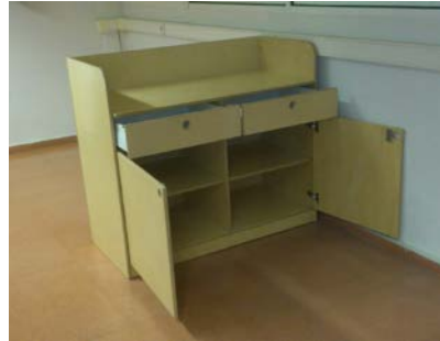
M6045C También disponible con puertas y cajones